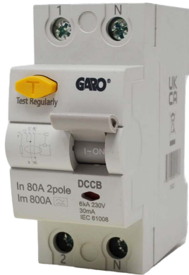
GCD 2P 80A